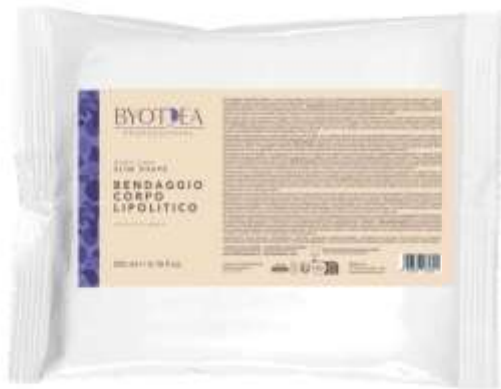
BANDAGE LAUNCHED in February 25 Inaugurated the new Slim Shape line