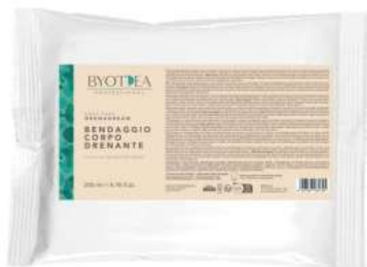
BANDAGE LAUNCHED in February 25 Inaugurated the new Drenadream line