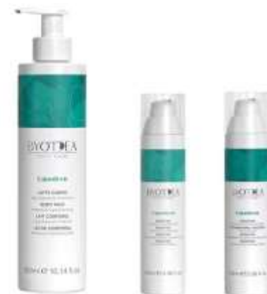
Lipodren retail line Coordinated with the professional line